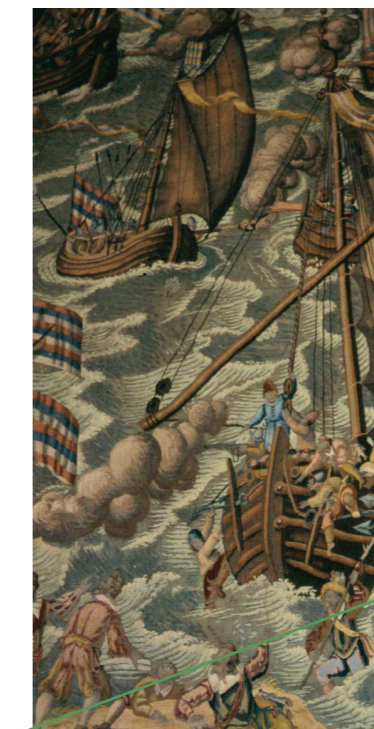
Detail wandtapijt Bluygen op Zoom.