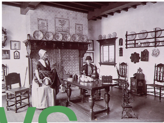
Welchse kamer, oude opstelling in Zeeuws Museum