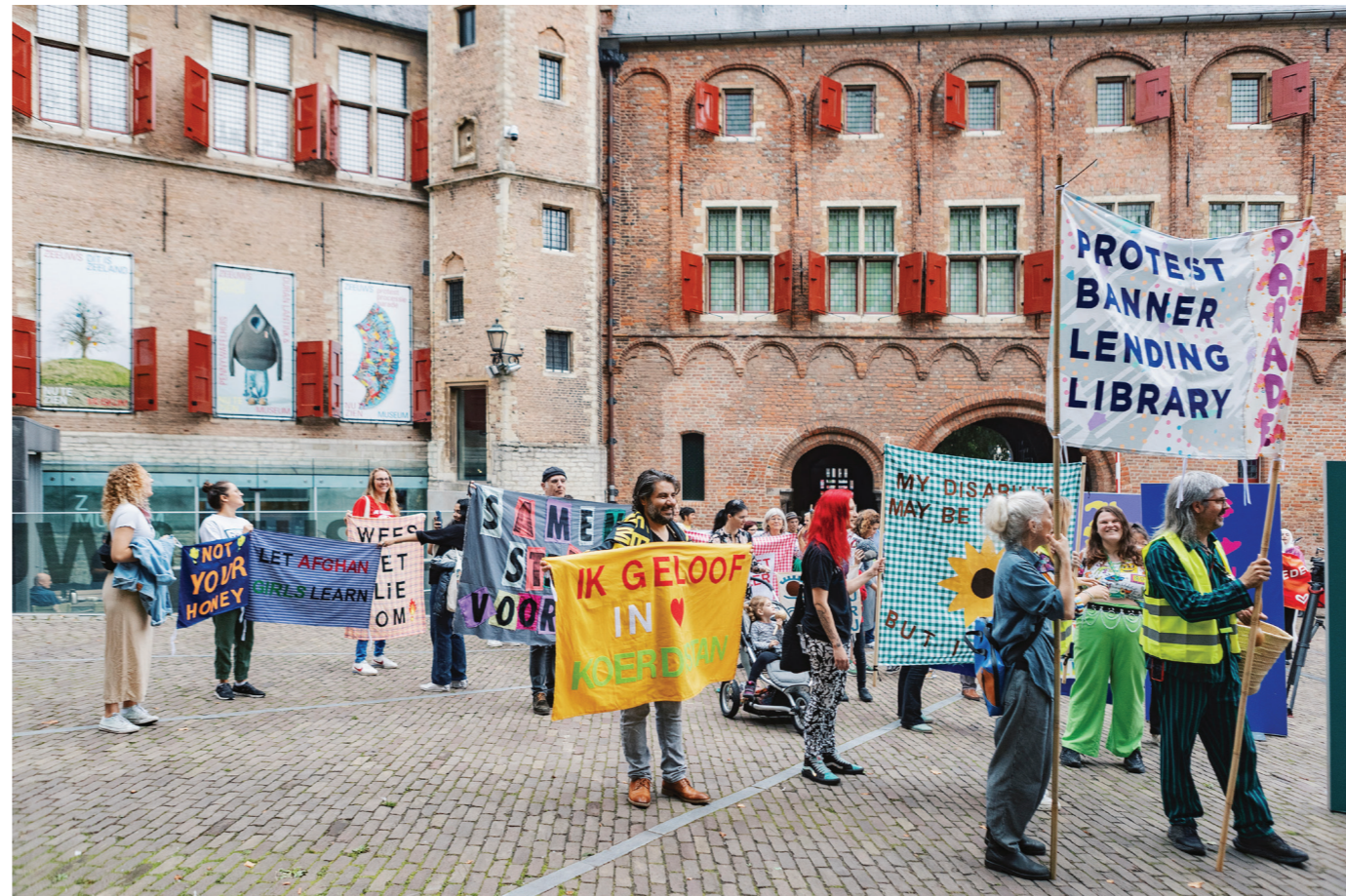
Manifestatie Protest Banners, 2023.

Verbeelding en creativiteit kunnen een belangrijke rol spelen in het ervaren van zingeving en betekenisvol contact. Door in gesprek te gaan of samen kunst te maken, kan er verbinding ontstaan die meer betekenis geeft aan het leven. Onder de naam eenZM ontwikkelen we sociale programma's met diverse maatschappelijke partners. Hiermee werken we aan een veerkrachtige en verbonden samenleving en proberen we gevoelens van eenzaamheid te verminderen. Zo kun je in de WERKPLAATS met je handen werken maar ook in gesprek met onze vrijwilligers. Een gesprek ontstaat makkelijker terwijl je samen aan iets werkt, is onze ervaring. Voor mensen met beginnende dementie en hun mantelzorgers is er de speciale rondleiding Onvergetelijk Zeeuws Museum .