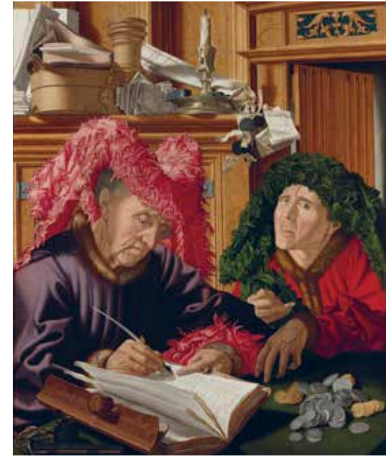
Atelier van Marinus van Reymerswale, Twee belastinginners, ca. 1540 (olieverf op paneel). © Collection National Gallery, Londen; inv.nr. NG844.