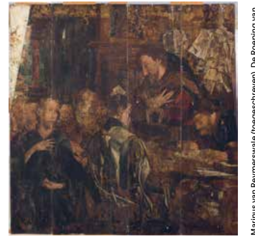
Marinus van Reymerswale (toegeschreven), De Roeping van Mattheus, 1530-1540 (olieverf op paneel). Collectie Zeeuws Museum.