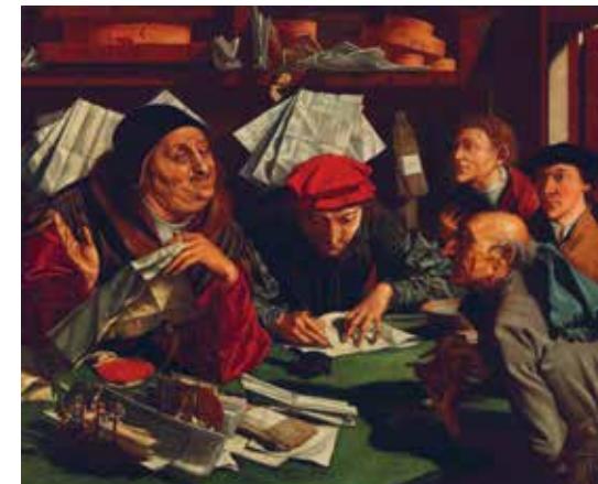
Marinus van Reymerswale, Advocatenkantoor, 1545 (olieverf op hout). Collectie The New Orleans Museum of Art, New Orleans. Aangekocht met steun van de Ella West Freeman Foundation Matching Fund.

Dit geldt ook voor De Roeping van Mattheus . In deze Bijbelse scène staat Mattheus in zijn kantoor waar hij als tollenaar belastingen heft in opdracht van de Romeinen. Hij wordt door Jezus aangesproken om hiermee te stoppen en hem te volgen.